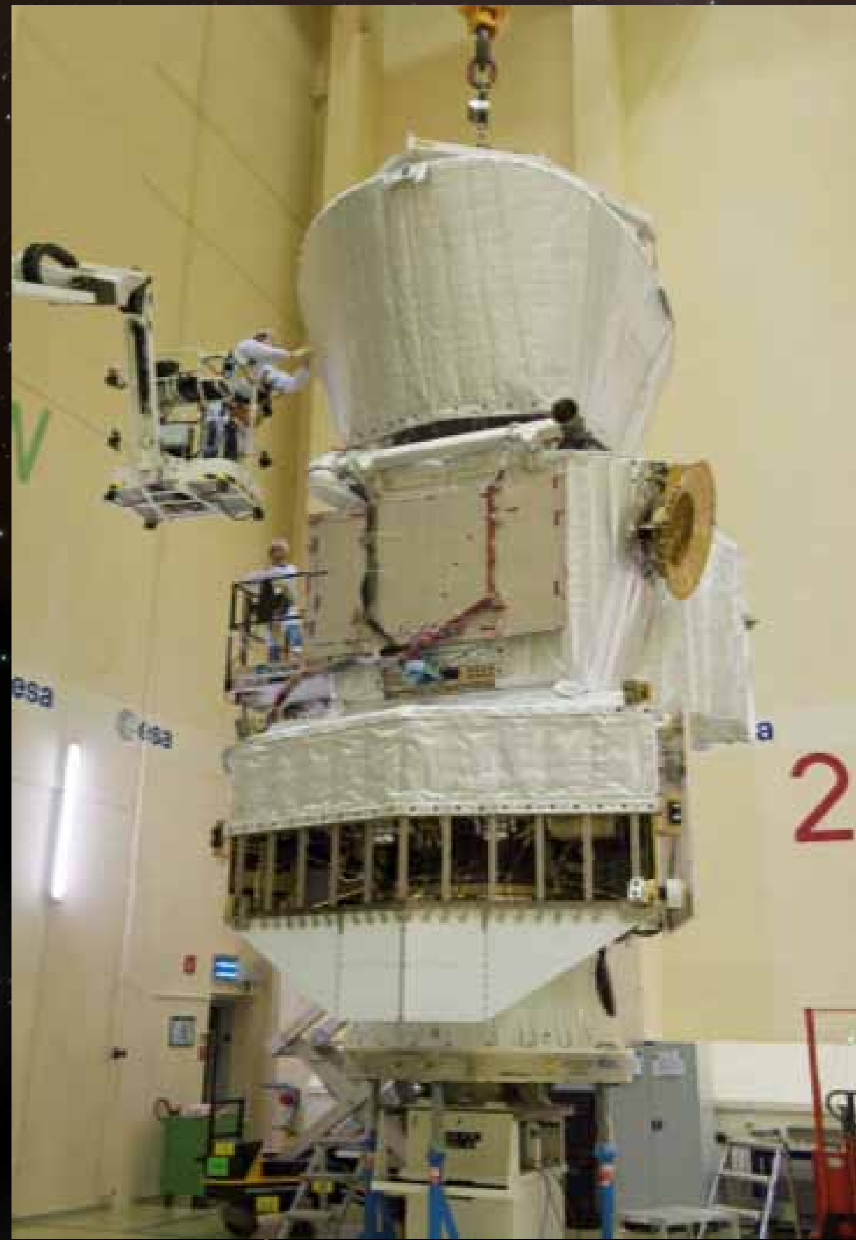
Immagine del satellite durante i test in ESA ad ESTEC (Olanda)

BepiColombo è una missione dell'ESA (Agenzia Spaziale Europea) e della JAXA (Agenzia spaziale Giapponese). E' costituita dal Mercury Planetary Orbiter (MPO), realizzato in Europa, e dal Mercury Magnetospheric Orbiter (MMO), realizzato in Giappone.